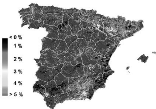
*Figura 2. Tasa del incremento relativo medio anual del NDVI, durante el período 1987-2001.

En la inmensa mayoría de los píxeles se obtuvieron pendientes positivas estadísticamente significativas. Poniéndose de manifiesto una clara tendencia hacia el incremento de la actividad fotosintética de la vegetación en España, durante el período estudiado 1987-2001. Con objeto de tener una estimación cuantitativa de este incremento, se han utilizado los ajustes de regresión de cada píxel en modo predictivo y se ha calculado la tasa de crecimiento relativo medio anual del NDVI para cada píxel, durante el período de tiempo considerado, tal y como se muestra en la Figura 2.