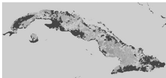
*Figura 1. Zonificación de las clases de coberturas terrestres en la isla de Cuba. Escala 1: 1000 000.

En este caso, el objetivo era obtener la distribución espacial de las coberturas terrestres de la Isla, que pudieran ser discriminadas por el sensor AVHRR-NOAA. De acuerdo con el alcance de la tarea, se fijó la escala 1:1 000 000 como la más apropiada. La metodología empleada, contempló la selección de las imágenes, el corte del área de interés; la corrección radiométrica y geométrica mediante puntos de control terrestres; la eliminación de nubes, la elaboración de compuestos periódicos; la selección de los campos de muestra de las clases informacionales que se pretendían identificar, el análisis estadístico de las muestras y la realización de la clasificación supervisada aplicando el algoritmo de mínima distancia. La clasificación así obtenida, permitió separar un total de 5 clases de coberturas terrestres como se aprecia en la Fig. 1.