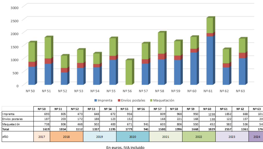
Figura 3. Evolución de costes de la Revista de la AET

Se presentan la evolución del Indicador SCImago Journal Rank (SJR) de Scopus (Figura 4)