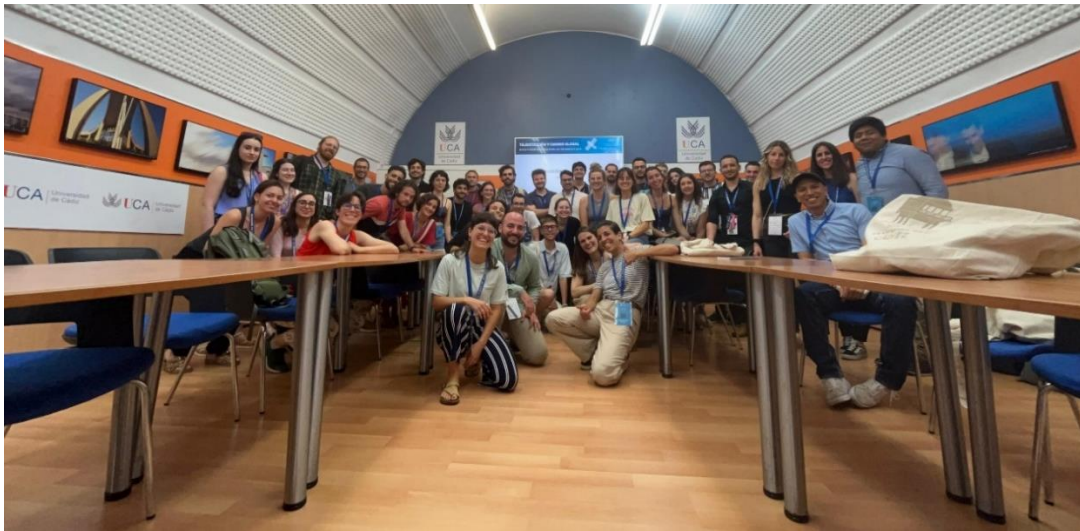
Imagen 01. Foto de grupo del primer encuentro de Jóvenes de la AET

Se realizó encuesta inicial para identificar el interés por la creación del Grupo de Jóvenes de la AET, recibándose 34 contestaciones (todas positivas).